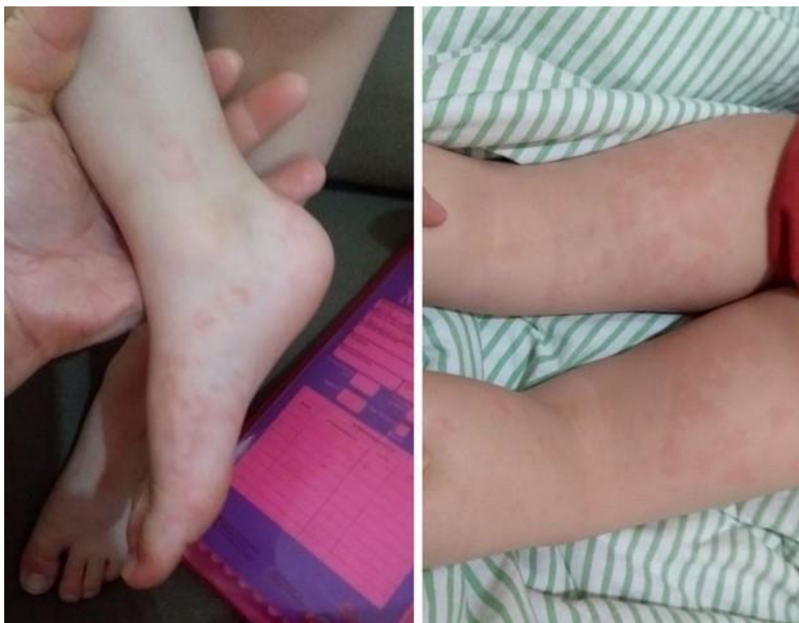
Manchas vermelhas no corpo de crianças podem ser sinais de covid?

14 SET 2020 - 14H22 ATUALIZADO EM 17 SET 2020 – 15H08